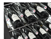
instelbare glazen planken