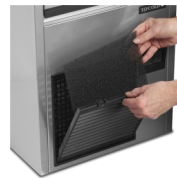
Gemakkelijk te reinigen condensfilter